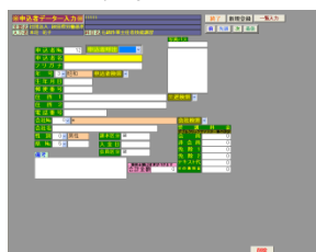
講習管理システム (ソフトベンダー提供)